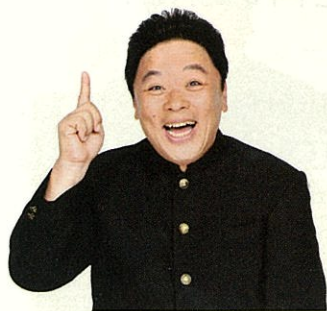
博士.com WEB キャラクター 伊集院光